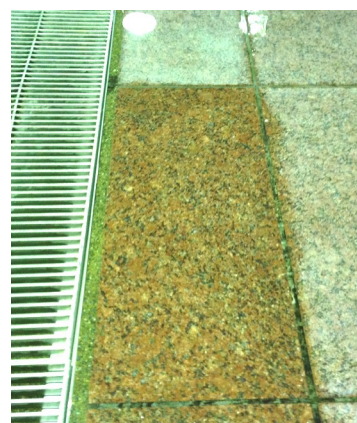
洗 浄 後